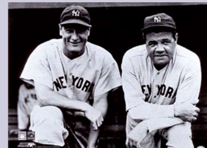
Lou Gehrig et Babe Ruth, les deux grandes stars du baseball des années 30